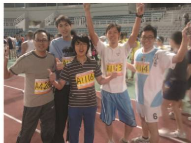
其中三位同工完成半程馬拉松