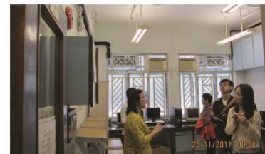
探訪香港救世軍漁灣宿舍

12月初，青暉舍四名同工赴港參加「兩岸四地兒童及青少年住宿照顧服務」研討會，來自廣東、台灣、香港、澳門的講者就不同範疇分享實務經驗。