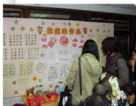
市民欣賞長者的手工藝創作