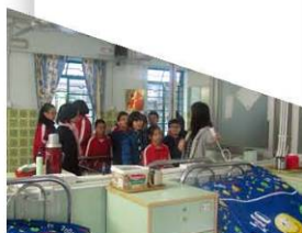
參觀者了解院舍環境