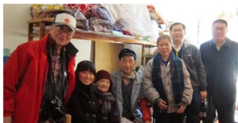
第三天會議與會者探訪本地貧困家庭

社會福利、教育、醫療等多方面作出相應的調整和改善，從而讓社會資源適當及公平分配。