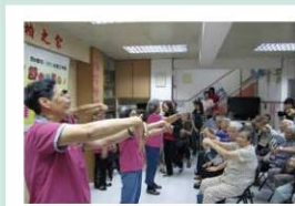
長者到松柏之家作緩痛運動示範

另外於10月底假明暉護養院舉行的「舒痛護老情」工作坊，共吸引200多名長者、護老者及相關員工參與。當天設有緩痛運動示範，讓在場人士動起來，舒展筋骨，並以分場方式介紹歡樂瑜珈、中醫、藥物處理、物理治療、職業治療及心理治療，供參加者親身體會舒緩痛症之各種方法。同時，現場亦設有輔助器具展示。