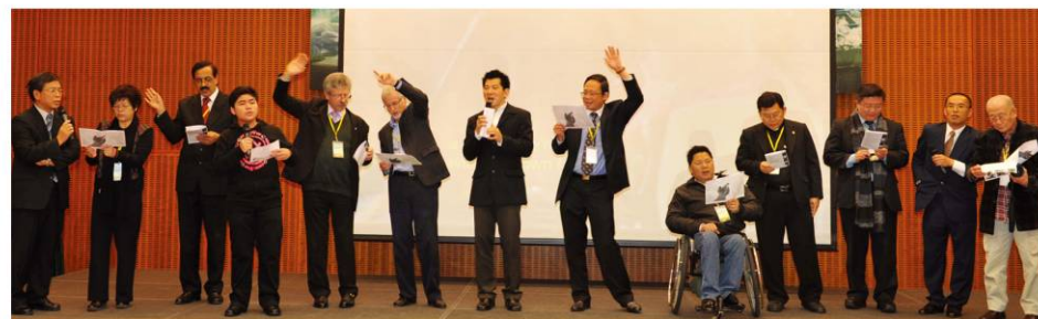
在閉幕禮上一眾嘉賓合唱「We are the World」以表達世界共融