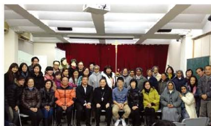
黎主教與明愛同工合照留念

就讓此薪火相傳，讓賢者的宏觀視野，活在每個具理想和願景的社工心中，積極面對當前澳門社會及經濟發展給我們帶來的挑戰！