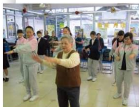
學生們與長者開心互動

同事們，在正面的評價背後，也代表著市民對明愛服務水平和質素的期望。大家努力，加油！