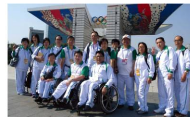
澳門代表團在首爾的奧運五環公園前留影