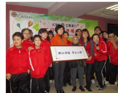
長者向工銀澳門送上愛心牌匾

除多個精彩節目表演之外，工行的義工們更到戶訪談及送贈禦寒羽絨服，為長者做好防冬準備。長者在收到這份合時貼心的禮物後都表現得十分興奮，聲聲感謝企業的愛心與關懷，溫情洋溢。