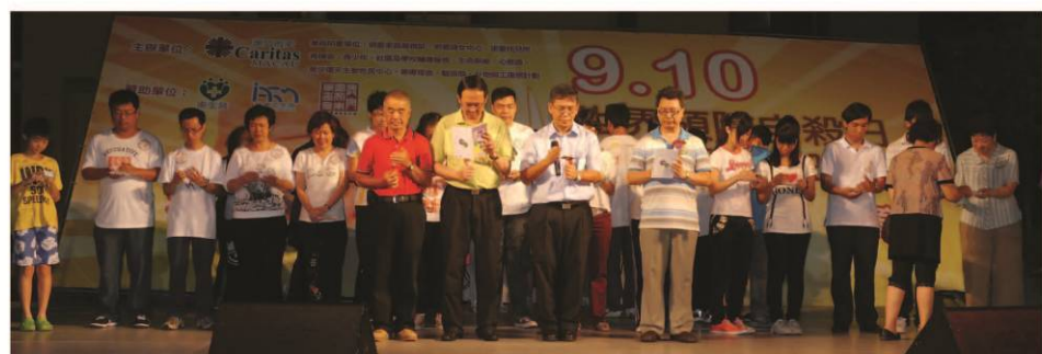
一同燃點燭光以示對預防自殺信念的支持

世界預防自殺日（9月10日）當天於塔石廣場舉行的社區推廣，設有資訊展板、攤位遊戲、壓力測驗、舞台表演和生命勇士分享，向社會大眾宣傳有關自殺問題的統計、高危人士的辨識、處理情緒的方法以及社區的求助途徑。當晚更進行燭光燃點儀式，以示對預防自殺信念的支持。