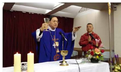
黎鴻昇主教主持感恩彌撒

黎主教在彌撒講道中，訓勉明愛同仁共同為有需要及受苦難的民眾服務，並應效法剛於2011年中辭世的陸毅神父無私奉獻的精神，全心全意，廣濟貧困無依的老弱殘疾者，分擔他們的痛楚。